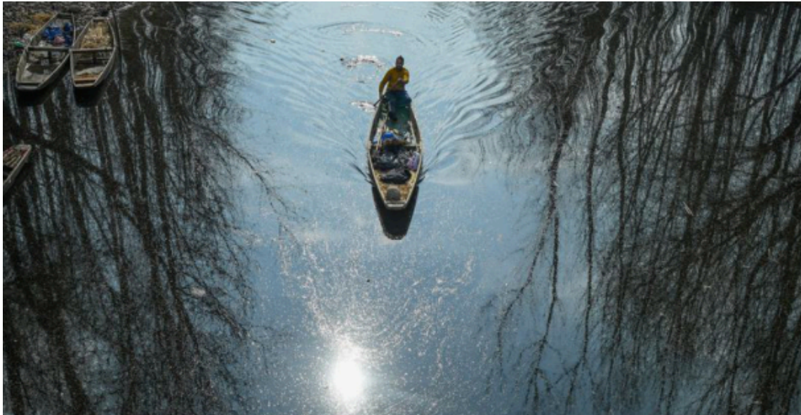
কাশ্মীৰত পুৱাৰ শীত ফালি এইদৰে নাও লৈ জীৱিকাৰ সন্ধানত এজন লোক, ফটোঃ ইমৰাণ নিছাৰ

পষেকত ৫ গৰাকীক যুৱতীয়ে অনাকাঙ্ক্ষিত মৃত্যুক আকোৱালি লোৱাৰ খবৰে কামৰ বাবে ঘৰ এৰি অহা যুৱতীৰ পৰিয়াল চিন্তিত হোৱাতো স্বাভাৱিক হৈ পৰিছে। এগৰাকী যুৱতীক দিনৰ পোহৰতে ৰাজপথত ডেগাৰেৰে আক্ৰমণ শেষাংশ ২ পৃষ্ঠাত