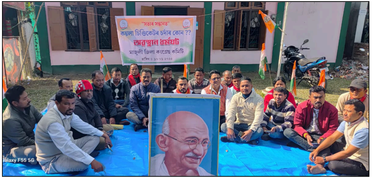
মাজুলীত জিলা কংগ্ৰেছৰ অৱস্থান ধৰ্মঘট

সন্দৰ্ভত এই অৱস্থান ধৰ্মঘট কাৰ্যসূচী ৰূপায়ণ কৰে কংগ্ৰেছ দলে। কয়লাৰ লগতে অবৈধ শিল, বালি আৰু বাৰ্মিজ ছুপাৰিৰ অবৈধ বেহা বন্ধ কৰাৰ দাবীত এই অৱস্থান ধৰ্মঘট কাৰ্যসূচী ৰূপায়িত কৰে। কয়লা খনন কৰিলে সেয়া বিজ্ঞানসন্মত তথা পদ্ধতিগতভাৱে কৰাৰ দাবী জনায় যোৰহাটৰ কংগ্ৰেছ কৰ্মীসকলে।