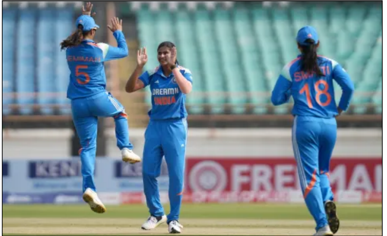
ৰাজকোটত অনুষ্ঠিত মহিলা দলৰ প্ৰথম এদিনীয়াত আয়াৰলেণ্ডৰ উইকেট দখলৰ পিছত উল্লাস টিতাহ সাধুৰ

ই-সংবাদ, ৰঙিয়া, ১০ জানুৱাৰীঃ ৰঙিয়াৰ কেকেনীকুছিত কৃষ্টি বিকাশ যুৱক সংঘৰ উদ্যোগত ষষ্ঠ বাৰ্ষিক প্ৰাইজমানি টেনিছ বল ক্ৰিকেট প্ৰতিযোগিতাৰ আয়োজন কৰা হৈছে। অহা ১৮ আৰু ১৯ জানুৱাৰীত দুদিনীয়াকৈ আয়োজন কৰা প্ৰতিযোগিতাৰ প্ৰথম আৰু দ্বিতীয় পুৰস্কাৰ হিচাপে ট্ৰফীসহ ৫০০০ আৰু ২৫০০ টকা আগবঢ়োৱা হ'ব। সবিশেষ তথ্যৰ বাবে আগ্ৰহী দলসমূহে ৬৯০১৫২৮২১০ অথবা ৮৭২১০০৪৮৩০ ফোন নম্বৰযোগে যোগাযোগ কৰিব পাৰিব।